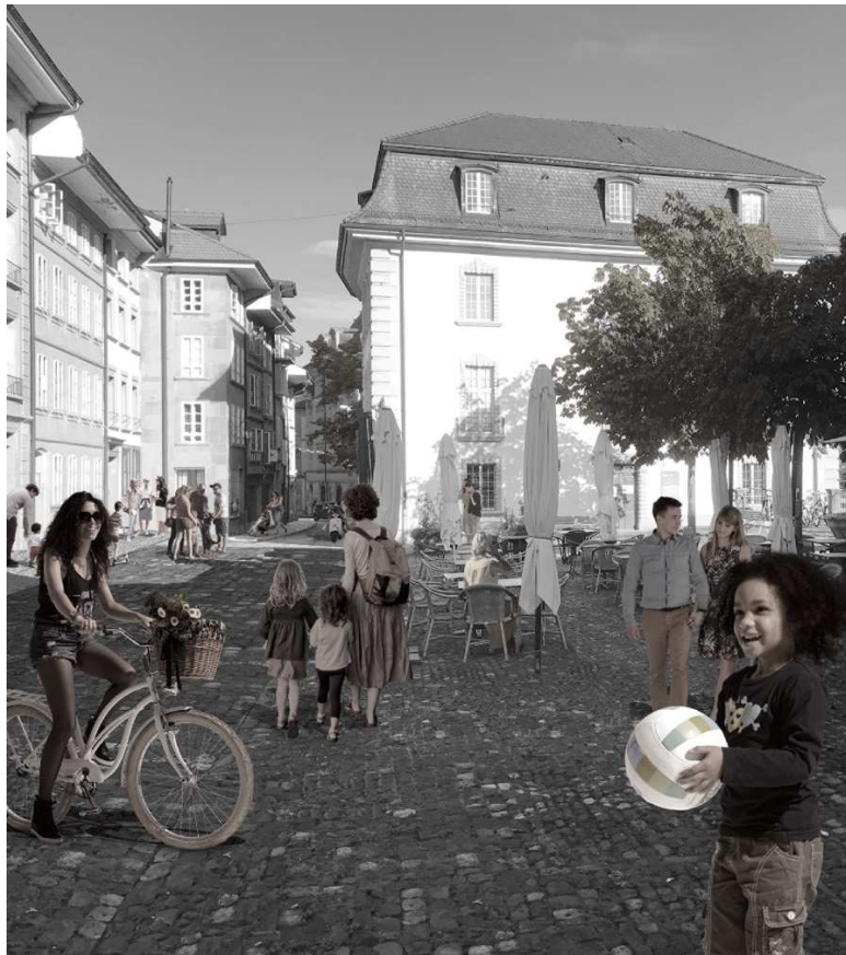
Figure 2 : Image de la place du Marché-aux-Poissons et de la rue Pierre-Aeby.

Afin de répondre à ces enjeux, le Conseil général, en date du 30 mars 2020, a validé l'engagement de CHF 215'000.00 TTC de crédit d'étude pour le suivi de la démarche participative et l'avancement des études jusqu'à la phase d'appel d'offres comprise.