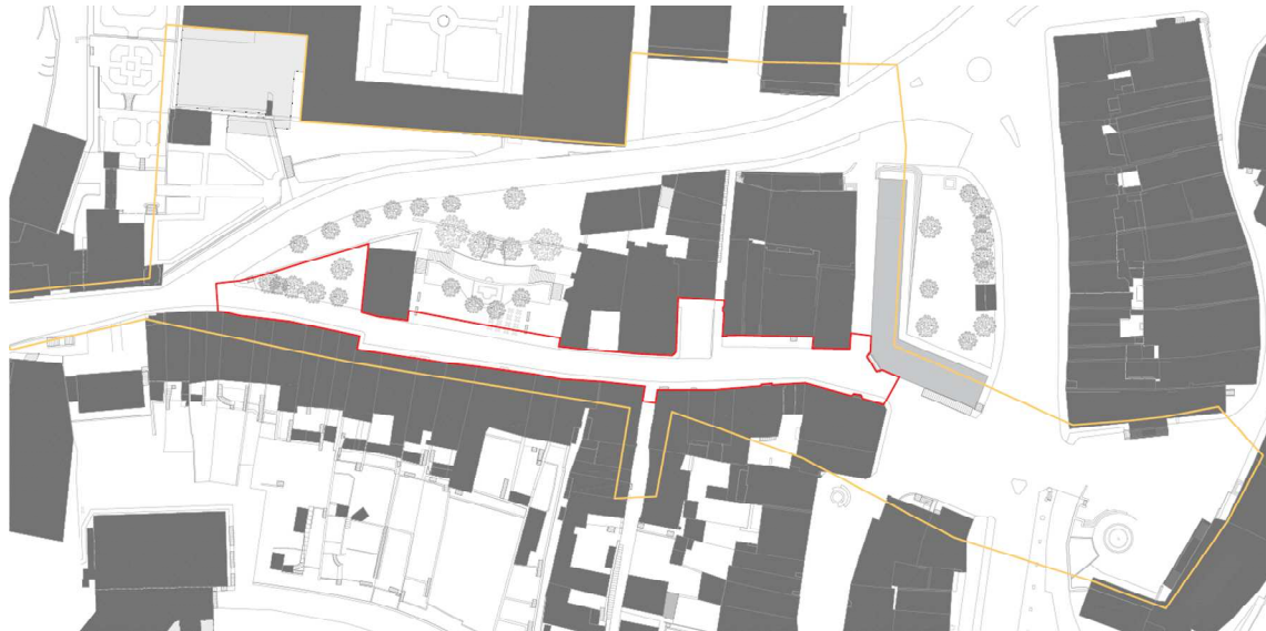
Figure 1 : Plan de situation

La place du Marché-aux-Poissons, en contact avec la rue de Morat n'a pas été intégrée au périmètre du projet. En effet, cette dernière fait partie d'une mesure de priorité C du projet d'agglomération de 3 ème génération (PA3). Elle sera donc développée et réalisée lors de l'étape 3 du projet de requalification du Bourg, dans un horizon 2030, environ 10 ans après la pose du revêtement phono-absorbant, réalisée à la rue de Morat en 2020.