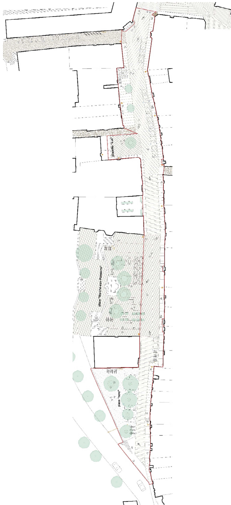
Figure 3 : Plan du projet